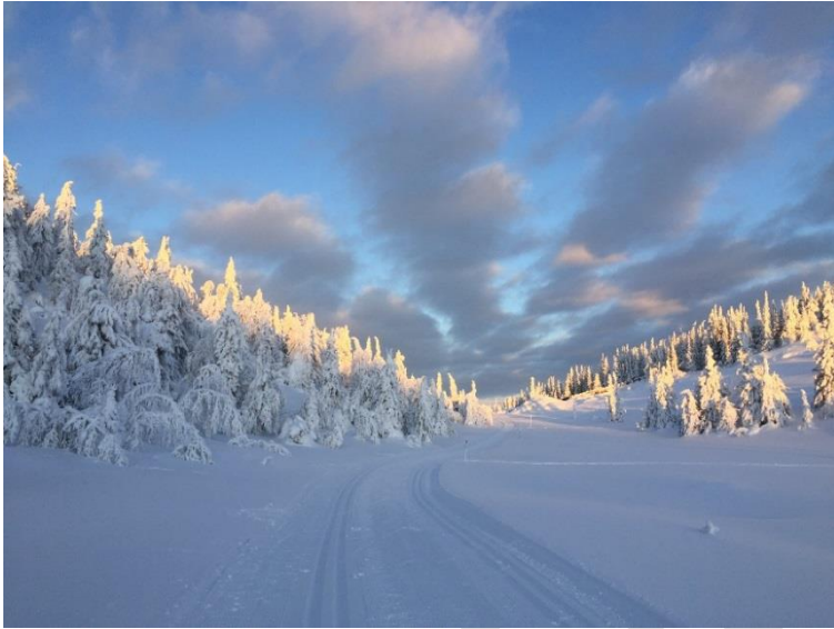
Vinterbildet kan symbolisere felles mål - alle linjer peker mot et sentralt punkt.

Nok en gang har vi rundet et 10-år og startet på et nytt. Måtte dette gi mange flere muligheten til å delta i arbeidet med å «gjøre verden til et bedre sted». Derfor må vi målrettet sørge for at flere vet om oss, hva Rotary gjør, og hvordan det er mulig å bidra.