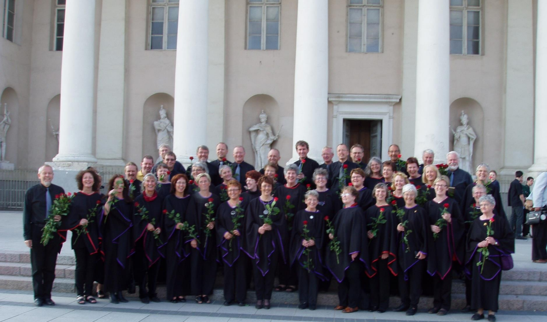
They came all the way from Panevezys to hear fellow rotarians in Kor Koselig sing.