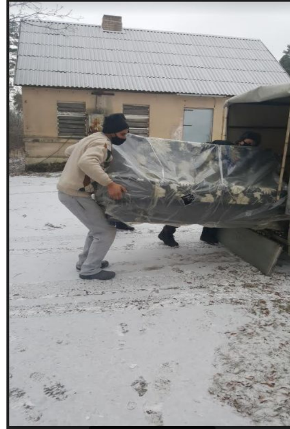
Just sharing news about family support. Folding sofa delivered to family.