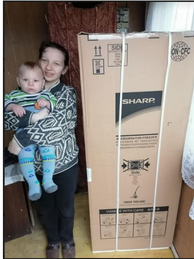
En ung familie i Krekenava mottok kjøleskap

Gaver til familier i Panevezys, desember 2020