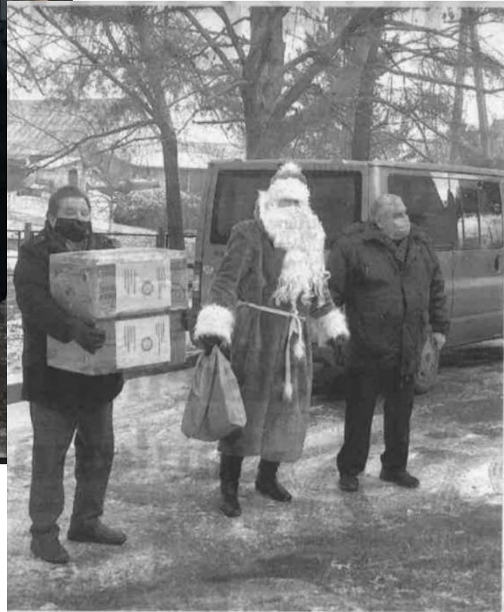
Veisiejos rotariečių dovanas Paketurių Šv. Kazimiero vaikų globos namams įteikė Kupiškio Rotary klubo prezidentas su Kalėdų Seneliu.