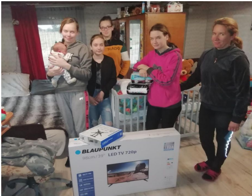
TV til en stor familie i Raguva